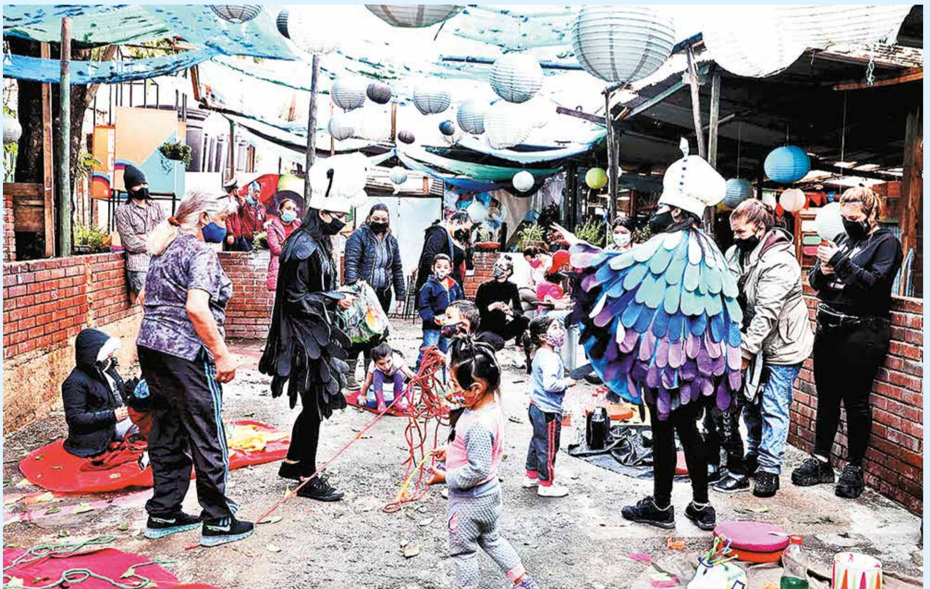
Con información de la Secretaría de Desarrollo Económico, Secretaría de Cultura, Recreación y deporte, la Alcaldía de Antonio Nariño e Idartes.

cargada de arte para los niños entre los 0 y 5 años que habitan o transitan las plazas de mercado de Bogotá.