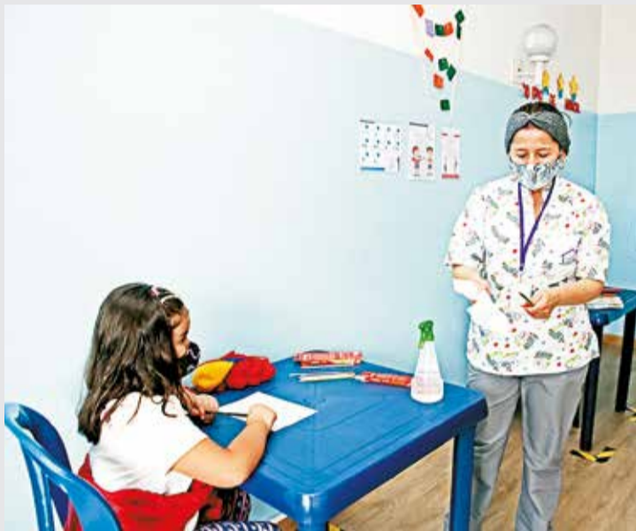
Por: Valeria Morales Rivera

La Fundación Otero Liévano es una organización sin ánimo de lucro que ayuda a las niñas, jóvenes y adolescentes en situación de vulnerabilidad, atiende mensualmente a más de mil niñas en sus sedes de Bogotá y Piedecuesta (Santander) a través de los programas de jardín, internado, externado y apoyo a bachilleres; en todos los casos brinda acompañamiento psicosocial, pedagógico, nutricional, vocacional y espiritual a las niñas y sus familias.